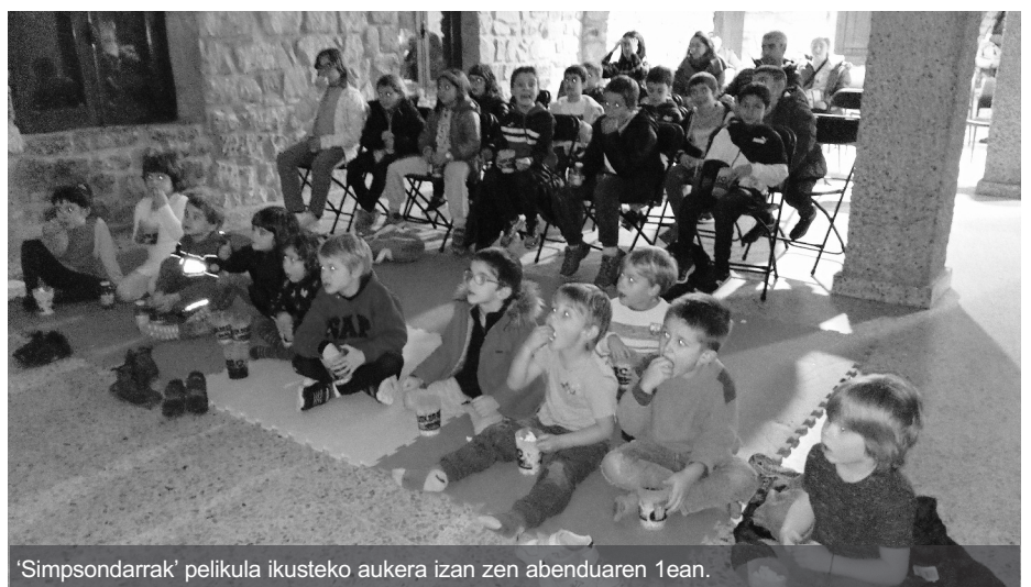
'Simpsondarrak' pelikula ikusteko aukera izan zen abenduaren 1ean.

Simpsondarrak pelikula ikusteko aukera izan zuten umeek eta sukaldaritzatzaileek ere egin zuten. Krepe eta fruta-brotxeta mundialak prestatu zituzten!