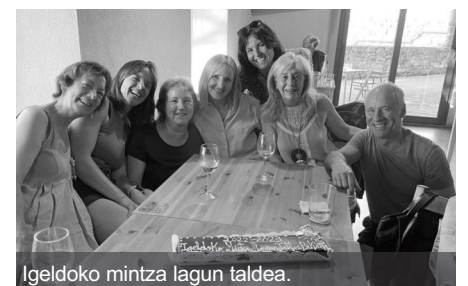
Igeldoko mintza lagun taldea.

Ikasturte bukaerako emanaldia izan zen ekainaren 16an. Hainbat ikastarotan ikasleek ikasitakoa erakusteko aukera izan zuten.