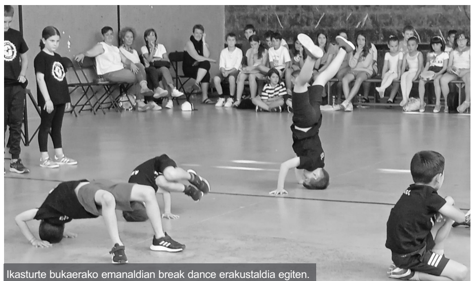
Ikasturte bukaerako emanaldian break dance erakustaldia egiten.