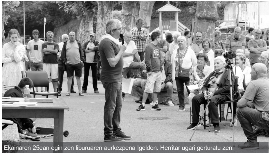
Ekainaren 25ean egin zen liburuaren aurkezpena Igeldon. Herritar ugari gerturatu zen.