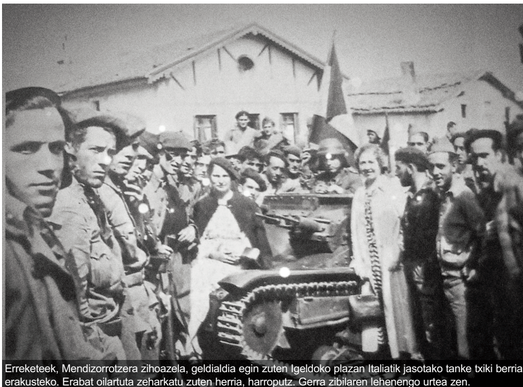
Erreketek, Mendizorrotzera zihoazela, geldialdia egin zuten Igeldoko plazan Italiatik jasotako tanke txiki berria erakusteko. Erabat oilartuta zeharkatu zuten herria, harroputz. Gerra zibilaren lehenengo urtea zen.

Momentuz ondo doa, baina gustatuko litzaidake 300 ale erreserbatzera iristea. Beraz, animatu dadila jendea! Kontuan izan dezatela ez dela liburu hau berriz argitaratuko inoiz. Elkarren argi esan digute; edizio bakarrekoa izango da.