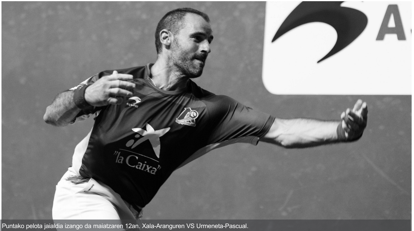
Puntako pelota jaialdia izango da maiatzaren 12an, Xala-Aranguren VS Urmeneta-Pascual.